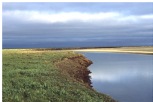
Abb. 3: Untersuchungsgebiet Kolguyev.

Der Permafrost findet sich etwa 75 cm unter der Oberfläche, an einigen Stellen kommt er sogar 38 cm unter der Vegetation vor. Bereits in der zweiten Hälfte des September fällt