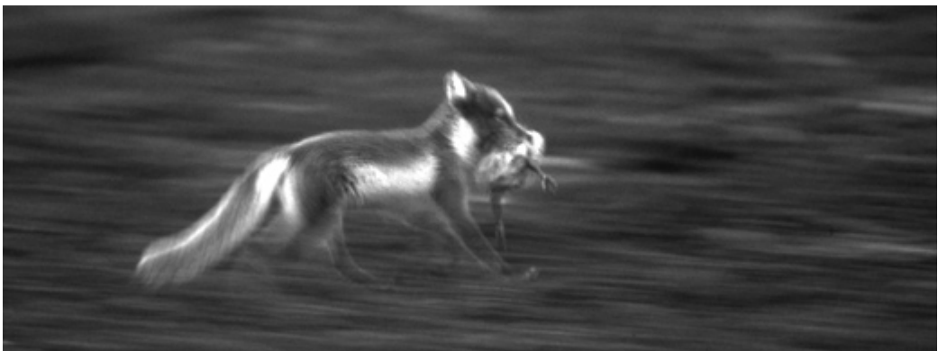
Abb. 6: Eisfuchse sind erfolgreiche Kükenjäger.

Besonders vor dem Hintergrund drohender Gefahr sind Gänse in ihrem Verhalten besonders anpassungsfähig. Verhaltensänderungen stehen immer in Zusammenhang mit konkreten Erfahrungen der Individuen. Diese sind nicht nur von der Prädatorenart abhängig, sondern maßgeblich auch von den Habitatbedingungen des Brutgebietes. So sind die Nonnengänse auf Svalbard allein durch das Fehlen höherer Vegetation aus Weiden oder Birken gezwungen, andere Strategien als ein Verbergen zu entwickeln. Je nach den äußeren Rahmenbedingungen können sie ihre Strategie anpassen und optimieren: während auf Svalbard die Ufernähe guten Schutz bietet, ist es auf Kolguyev entweder der Schutz der großen Gruppe oder der dichten Vegetation. Die Anwesenheit weiterer Fressfeinde mit anderen Jagdstrategien erfordert ebenfalls Anpassungen der Elternvögel. Die Kenntnis verschiedener Feinde und möglicher alternativer Verhaltensweisen ermöglicht die notwendige kurzfristige Verhaltensänderung. Dadurch erklärt sich, dass erfahrene Brutpaare