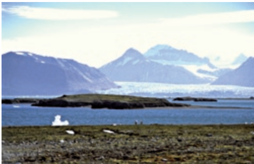
Abb. 2: Untersuchungsgebiet Kongsfjorden (Ny-Ålesund).

Ny-Ålesund ist die nördlichste menschliche Ansiedlung und liegt am Kongsfjorden (Svalbard / Spitzbergen, 78° 55'N, 11° 56'E). Es ist eine ehemalige Bergarbeitersiedlung, die heute ausschließlich für wissenschaftliche Zwecke durch Forschungsinstitute zahlreicher Staaten genutzt werden darf. Dem Dorf vorgelagert liegen mehrere kleine Inseln, die von Nonnengänsen als Koloniestandorte genutzt werden. Mit den Küken schwimmen die Nonnengänsen dann an das Festlandufer. Hier befinden sich mehrere kleine Seen, um die sich grasige und moosreiche Vegetation findet. Abseits der Seen wird das Gelände trockener, felsiger und die Vegetation ändert sich. Saxifragaceen dominieren hier.