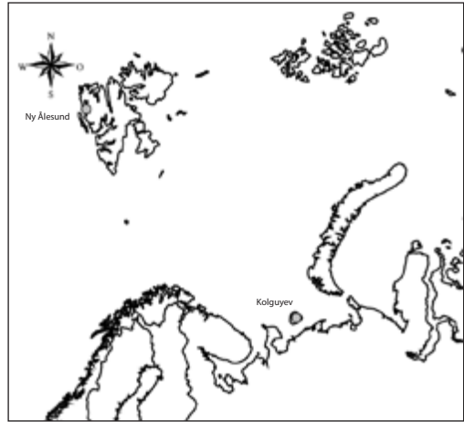
Abb. 1: Lage der Untersuchungsgebiete Ny-Ålesund, Svalbard und Kolguyev, Barentssee

Die Insel Kolguyev liegt abgeschieden und schwer erreichbar an der südöstlichen Schelfzone der Barentssee (69°N / 50°E). Sie ist 75 km in der Nord-Süd- und ca. 60 km in der West-Ost-Ausdehnung groß und liegt 70 km vor der Festlandküste. Die Gesamtgröße beträgt 5200 km 2 (Kruckenberg et al. 2008, Abb. 1). Die Insel ist umgeben von Sandbänken und wattenartigen Lagunen. Auf der Insel selbst können zwei Bereiche unterschieden werden: der nördliche Inselteil ist geprägt durch eine Moränenlandschaft mit Hügeln